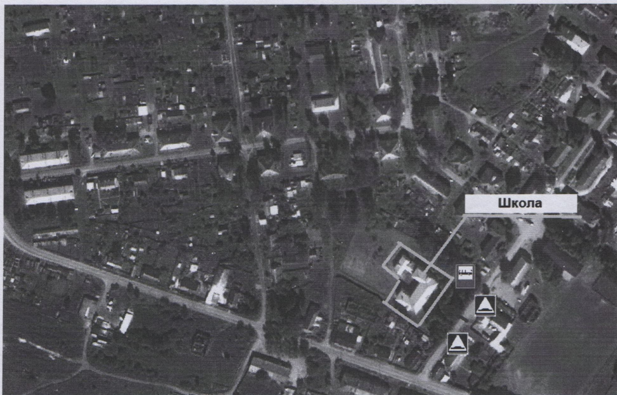
Рис. 2. План-схема организации дорожного движения в непосредственной близости от МОУ Берендеевской СШ

2) План-схема организации дорожного движения в непосредственной близости от МОУ Берендеевской СШ с размещением соответствующих технических средств, маршруты движения обучающихся и расположение парковочных мест;